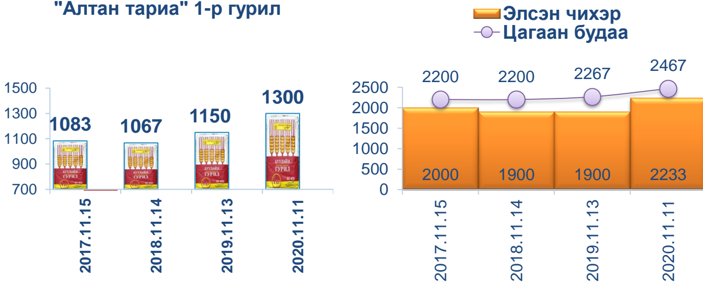
"Алтан тариа" 1-р гурил

Алтан тариа 1-р зэргийн гурил 1300 төгрөг, цагаан будаа 2467 төгрөг, элсэн чихэр 2233 төгрөгийн дундаж үнэтэй байна.