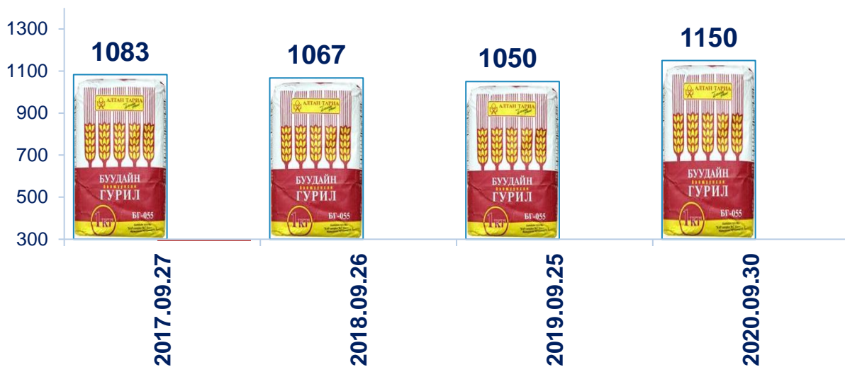
"Алтан тариа" 1-р гурил

Алтан тариа 1-р зэргийн гурил 1150 төгрөг, малын шингэн сүү /үхэр/ 2000 төгрөг, цагаан будаа 2467 төгрөг, элсэн чихэр 2033 төгрөгийн дундаж үнэтэй байна.