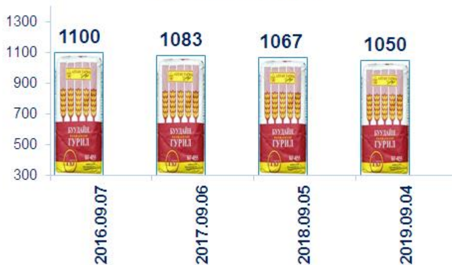
"Алтан тариа" 1-р гурил

Алтан тариа 1-р зэргийн гурил 1050 төгрөг, малын шингэн сүү /үхэр/ 2000 төгрөг, цагаан будаа 2267 төгрөг, элсэн чихэр 1900 төгрөгийн дундаж үнэтэй байна.